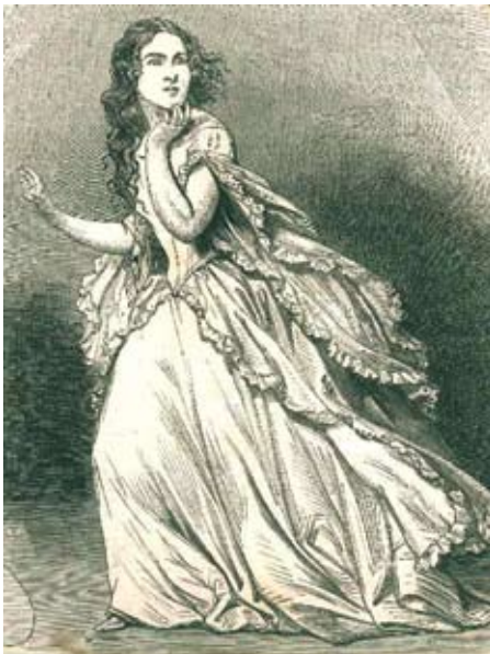
Jenny Lind als Lucia di Lammermoor (Donizetti), 1848