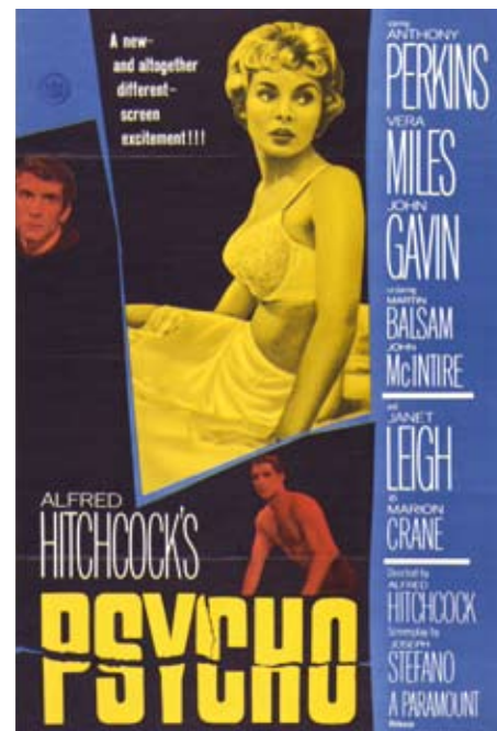
Psycho, Alfred Hitchcock, 1960

Artaud zelf schreef over zijn ziektegeschiedenis: 'j'assiste à Antonin Artaud.' 6 De