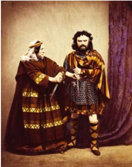
Typische illustraties van waanzinnige personages zoals vormgegeven in het theater van de 19de eeuw: Charles Kean en zijn vrouw als Macbeth and Lady Macbeth, 1858