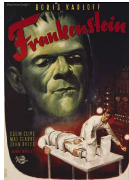
Frankenstein, James Whale, 1931