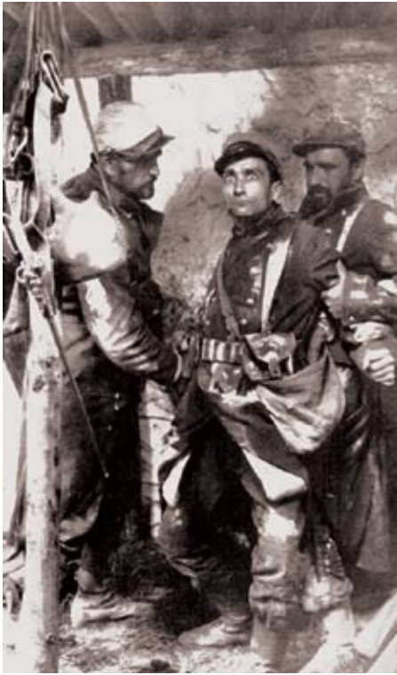
Antonin Artaud als Vieublé in Les Croix de Bois van Raymond Bernard (1932)

ARTAUD IS ALLESBEHALVE DE ONTHECHTE THEORETICUS DIE, NADAT HIJ EEN LEVEN LANG HET FENOMEEN TONEEL HEEFT GECONTEMPLEERD, MET EEN DOORWROCHTE ANALYSE OP DE PROPPEN KOMT. EVENMIN IS HIJ DE DOOR DE WOL GEVERFDE PRAKTIJKMAN.