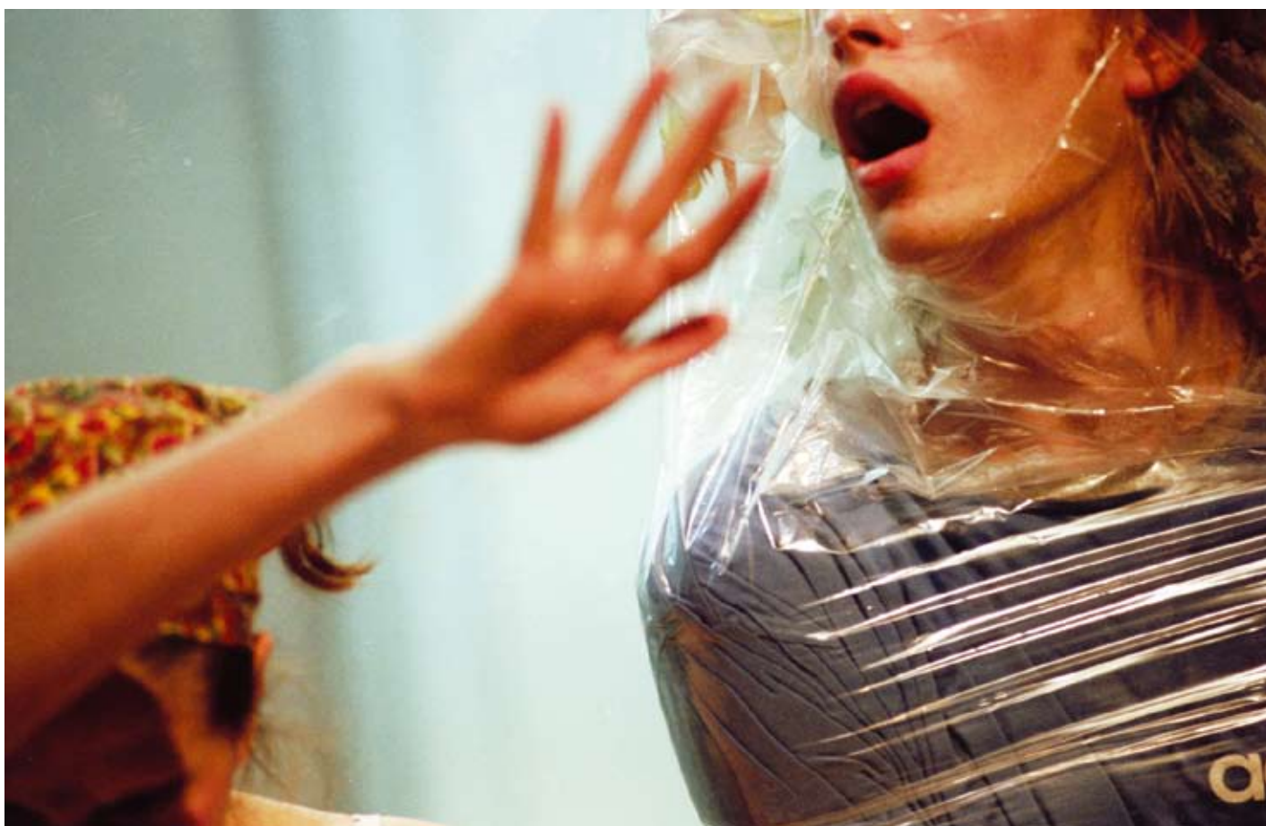
Scènes van alledaagse waanzin komen vaak voor in Allemaal Indiaan (1999) van Arne Sierens & Alain Platel