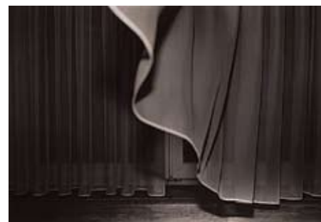
Dirk Braeckman maakt in zijn foto's van de zogenaamde realiteit een theateraal gezicht. I.P.-E.E.-01, 2001